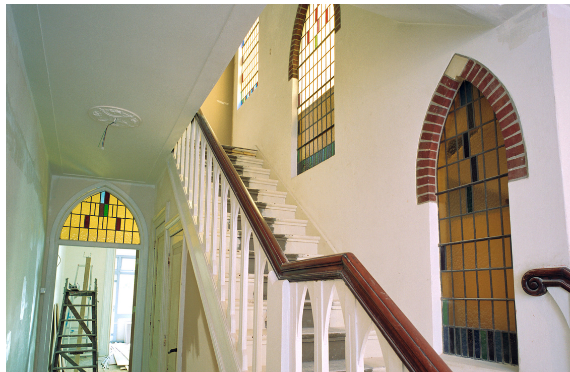
Glas in lood

Een relatief goedkope optie is energiebesparende folie. Deze plak je achter het raam en zo krijg je een isolerende laag tussen het folie en het raam.