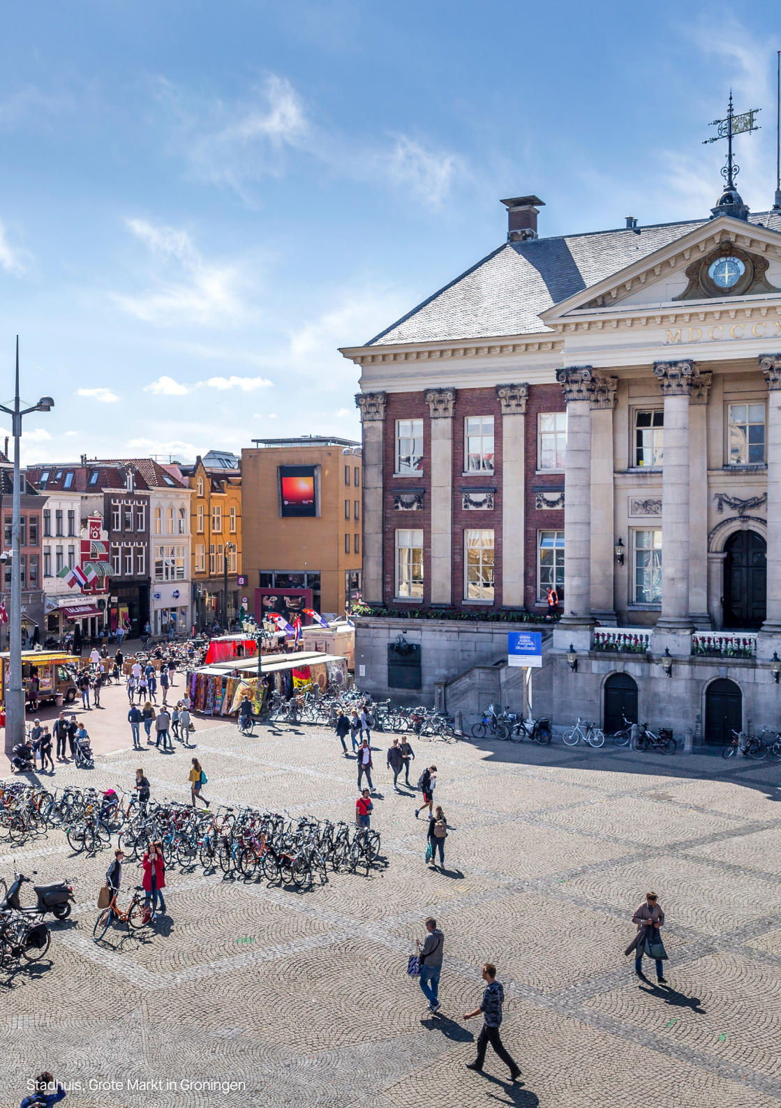
Stadhuis, Grote Markt in Groningen