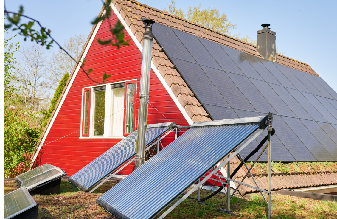
Zonnepanelen en zonnecollectoren

Voor het plaatsen van een zonnecollector gelden vaak dezelfde regels als voor het plaatsen van pv-panelen. Er bestaan onzichtbare systemen die onder de dakpannen worden geplaatst. De dakpannen geven de warmte van de zon dan door aan de installatie. Voorwaarde hierbij is wel dat de oorspronkelijke dakbedekking niet verwijderd wordt.